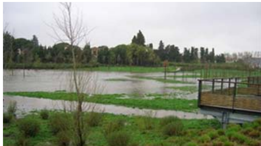
Sant-Vicens le 16 mars dernier

Comme nous l'explique, Joëlle Anglade, conseillère municipale déléguée à l'environnement : « Si quelques Perpignanais se sont inquiétés de voir le parking du parc inondé, qu'ils se rassurent ! L'ensemble du site de Sant Vicens est d'abord un bassin de rétention qui a été conçu pour protéger les riverains contre les inondations. Le site est conçu sous forme de 4 zones inondables en cascades, qui se remplissent les unes après les autres, selon l'importance des pluies (y compris le parking). Au total, ce sont 60 000 m 3 qui peuvent être retenus par ce système de rétention. Et c'est justement ce qui a permis aux habitants du quartier de garder les pieds au sec ! ».